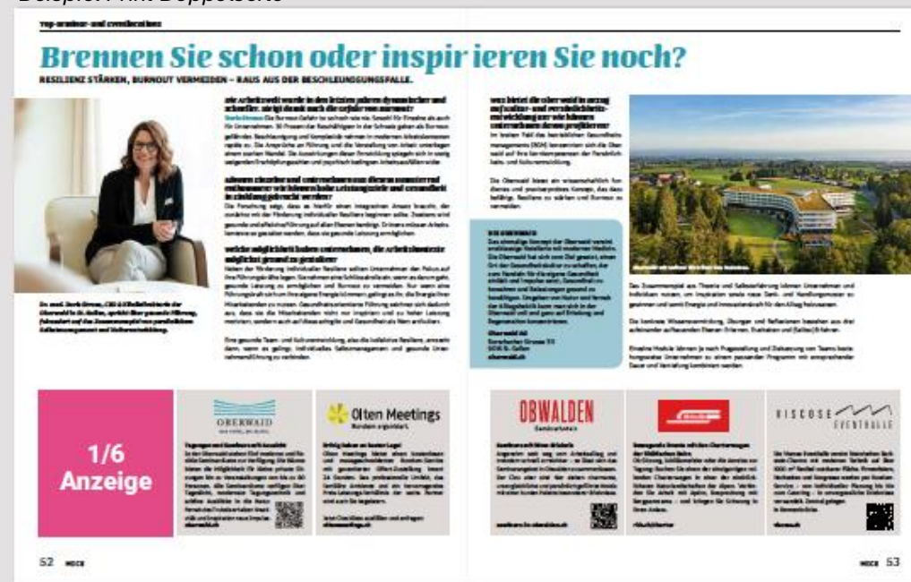
Beispiel Print Doppelseite

Unsere Erfahrung zeigt: Der mediale Mix aus Print, Online und Social Media ist entscheidend für den Erfolg. Das Printmagazin erzielt Visualität (hochwertig und langlebig) Online optimiert die Reichweite und generiert CTA's